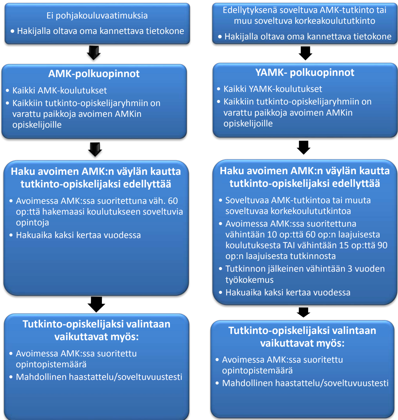
Kuvio 2. Avoimen AMKin polkuopinnot

Toisen asteen tutkinnon suorittaneille avoin ammattikorkeakoulu tarjoaa mahdollisuuden opiskella väyläopintoja , jotka ovat Lapin AMKin koulutuskohtaisesti määrittelemiä opintoja. Koulutusten tarjoamat väyläopinnot edellyttävät soveltuvaa perustutkintoa. Lisäksi sosiaali- ja terveysalan koulutuksissa (sairaanhoitaja, terveydenhoitaja, sosionomi, geronomi, fysioterapia sekä liikunta ja vapaa-aika) opiskelijan opintomenestyksen edellytetään olevan vähintään tasolla hyvä. Väyläopiskelijat opiskelevat tutkinto-opiskelijaryhmässä lukujärjestyksen mukaan. Avoimen AMKin väyläopinnot ovat pääsääntöisesti tutkintoon johtavan koulutuksen ensimmäisen lukuvuoden opintoja ja